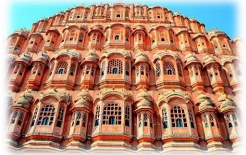
Foto Stopp am Palast der Winde: Palast der Winde leitet seinen Namen von seiner einzigartigen Struktur ab, bei der es sich um ein Geflecht aus kleinen Fenstern handelt, die kühlen Wind in den Palast eindringen ließen und den Palast daher während der heißen Sommermonate komfortabel hielten. Der Hauptgrund für den Bau des Palastes bestand darin, den Frauen des Königshauses zu ermöglichen, die Feierlichkeiten auf den Straßen zu beobachten, ohne von außen gesehen zu werden, wie es im Land üblich war. Es befindet sich direkt am Rand des City Palace Jaipur und erstreckt sich bis zur „Zenana“

Der City Palace – eine herausragende Vereinigung rajputischer und mogulischer Architektur. Der siebenstöckige Chandra Mahal (Mondpalast) ist ein weitläufiger Komplex mit zahlreichen Höfen, öffentlichen Gebäuden, einem astronomischen Observatorium und dem Zenat Mahal (Harem). Im Inneren des Palastes befinden sich einige Museen sowie eine interessante Textilausstellung, die eine Auswahl feinsten Stoffe und Kleider aus der königlichen Sammlung sowie die Waffenkammer der Mogule und Rajputen zeigt.